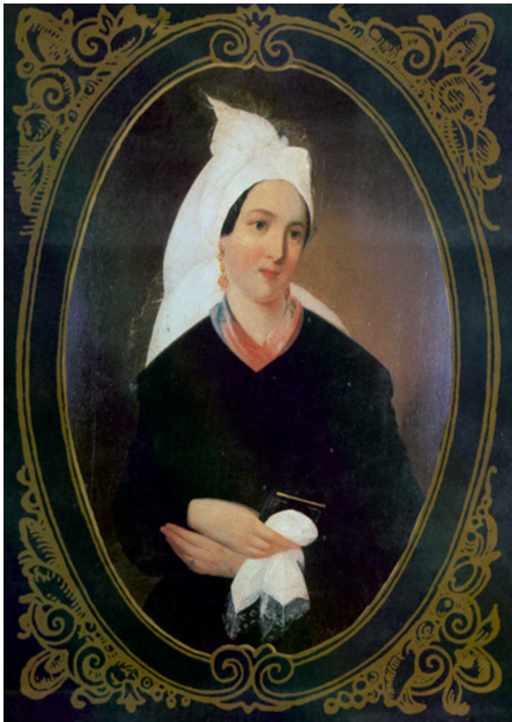
Stroj, kmetica iz okolice Ljubljane, 1853