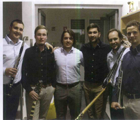
Veselo razpoloženi člani ansambla Sekstakord, takoj po prihodu z odra.