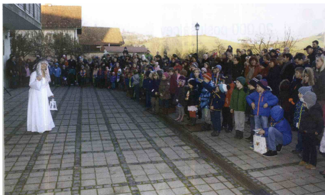
Predstava je bila zelo obiskana.

aksijske skupine od Pohorja do Bohorja, in sicer iz Oplotnice. »Ta sejem ima poseben čar, saj je to prvi decembrski dogodek. Trudimo se z dogajanjem v starem trškem jedru, čeprav bi si ga želeli še več. Letos smo še posebej ponosni na praznično osvetljava, ki bo zaživela, ko se bo stemnilo. Prvič po nekaj letih bomo ponovno okrasili staro trško jedro, saj smo letos dobili tudi prestižno imenovanje za najlepše urejeno trško jedro v Sloveniji, tako da smo se še s tega vidika malo bolj potrudili.« Dogajanje ob stojnicah sta med drugimi popestrila tudi predstavnika Mladinskega centra Šentjur Jurka in Ambrož, ki sta zabavala otroke ter vabila k stojnici mladinskega centra. Zbrani so si lahko privoščili tudi kakšen kozarček kuhanega vina in še kakšne dobrote. (A.K.)