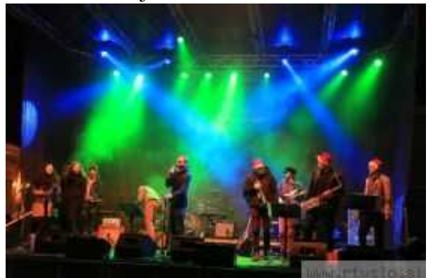
Obiskovalcem se je predstavila tudi številna domača zasedba Uranium Pills Project.