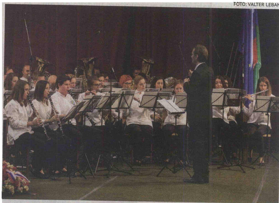
Tudi cerkniški godbeniki se že intenzivno pripravljajo na božično-novoletni koncert.