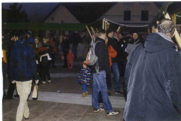
Na sejmu je bilo poskrbljeno za dobro voljo in dobro postrežbo ter ponudbo.