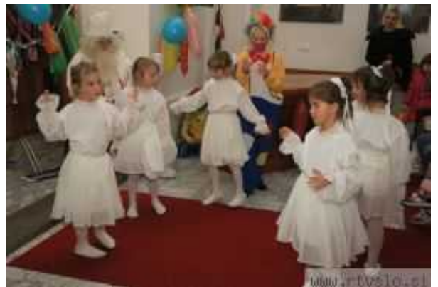
Najmlajše je obiskal tudi Dedek Mraz s snežinkami.