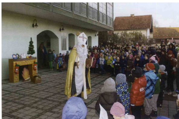
Miklavž je otrokom razdelil medenjake.