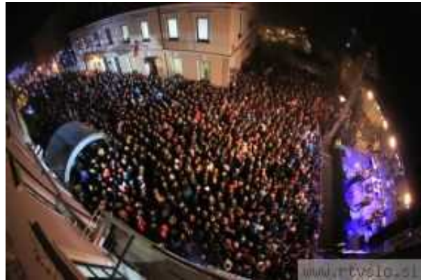
Ob koncu Prazničnega vikenda v Krškem so Modrijani povsem napolnili glavno ulico v starem mestnem jedru.

V obeh dneh so se na stojnicah predstavili domači rokodelci in drugi ponudniki, ki so poskrbeli za bogato sejmsko božično-novoletno ponudbo. Ob tem so na več lokacijah po mestu pripravili tudi bogat kulturni program. Tako so v Mestnem muzeju organizirali delavnice izdelave božičnega darila in božičnih okraskov, Valvasorjeva knjižnica je za najmlajše pripravila lutkovno predstavo Zvezdica Zaspanka, učenci Glasbene šole Krško so se predstavili z božičnim