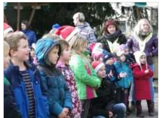
Trebanjski mestni park so dopoldne preplavili otroci, ki so tradicionalno okrasili drevesa in grmičke.