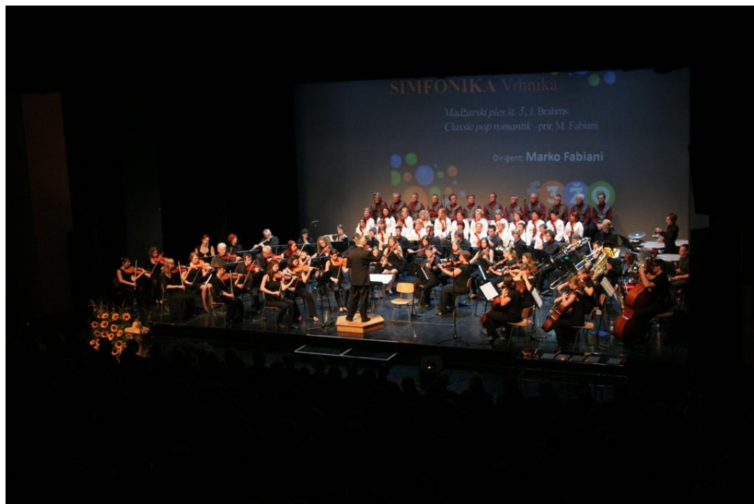
Slika: Otvoritev F3ŽO

Rdeča nit programa je temeljila na povezovanju treh generacij (Derenda, Ahačič Pollakova, Ferenčak), ki se je kazala tudi v izboru kulturnega programa: