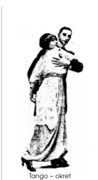
Tango – okret