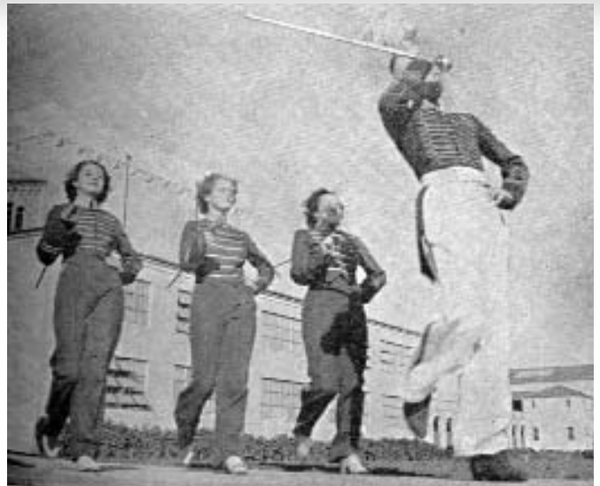
Iz članka o "poskakovalnem plesu" v Ameriki, ki je bil objavljen v februarški številki revije Žena in dom leta 1939.