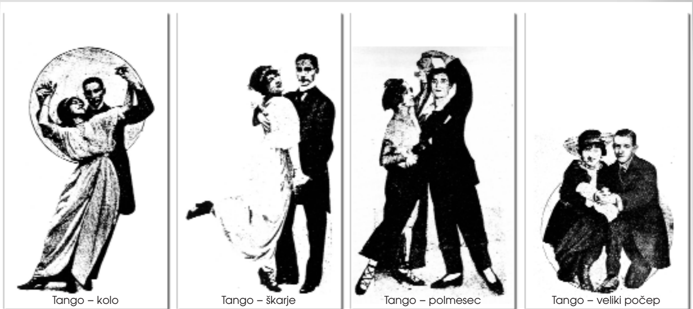
Prikaz korakov in položajev pri tangu v času med obema vojnama. (Iz knjige: Dragan Matič: Kulturni utrip Ljubljanec med prvo svetovno vojno, Ljubljana, 1995.)

jo plešemo danes. Moč in raznoterost latinskoameriških plesov je bila izražena v glasbi, njeni ritmiki in nenavadnih inštrumentih, ki prav tako večinoma izvirajo iz Afrike. In inštrumenti, kot so claves, marakas, najrazličnejša tolkala, so dajali značilnost latinskoameriški glasbi in gibanju.