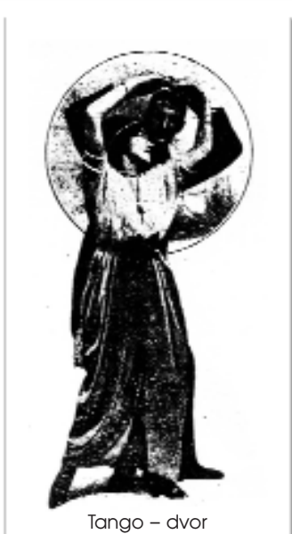
Tango – dvor