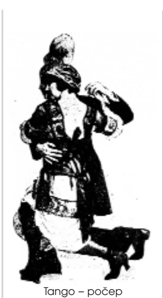
Tango – počep