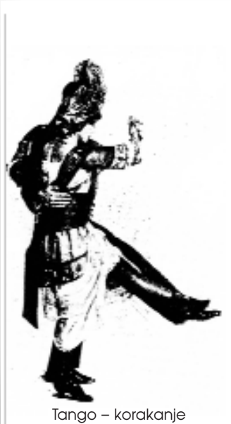
Tango – korakanje

Leta 1931 je imel na plesiščih, ki so sledila plesni modi, vodilno vlogo beguine – vrsta dokaj hitre rumbe , ki izvira z otoka Martinique in izhaja iz preoblikovanih cerkvenih pesmi; sledili so mu mambo , bolero , quaracha in calypso . Rumba sicer izvira iz Afrike ( Nigerija ), od koder so jo preko Španije zanesli na Kubo . V sebi nosi celo vrsto ritmov. Sprva se je plesala v obliki kvadrata ( danzon ), sledila ji je hitrejša oblika ( guaracha ), pozneje beguin in nato najpočasnejša oblika – rumba bolero ter cuban rumba , ki