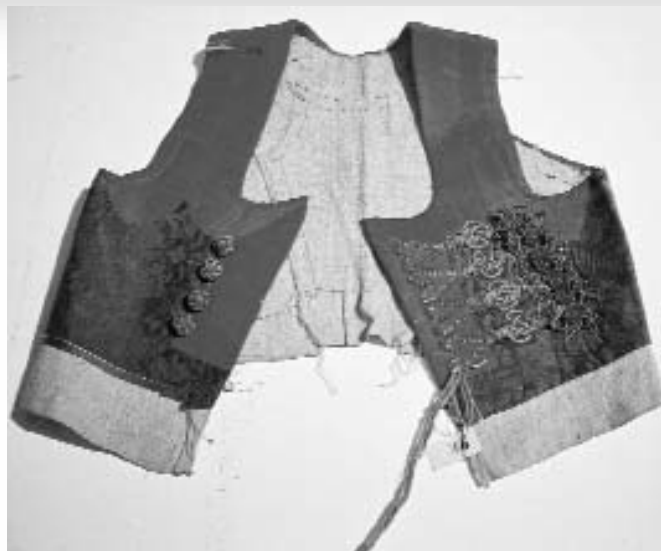
Životek, ki ga je v St. Peterburg poslal Matija Majar Ziljski.

bi projekt uspel. Odločil se je, da bo napel vse sile in poslal na razstavo predmete, med drugim tudi obleke, ki so jih bili zaradi celostnega prikaza v St. Peterburgu še posebej veseli in so sodili med najbolj cenjene muzejske eksponate. Na razstavi je želel čim bolj natančno prikazati "kranjsko svadbo z vsemi pritiklinami, samo brez konja in voza" (Čurkina 1974: 129), pri čemer je treba poudariti, da je kot kranjska mišljena ziljska svatba .