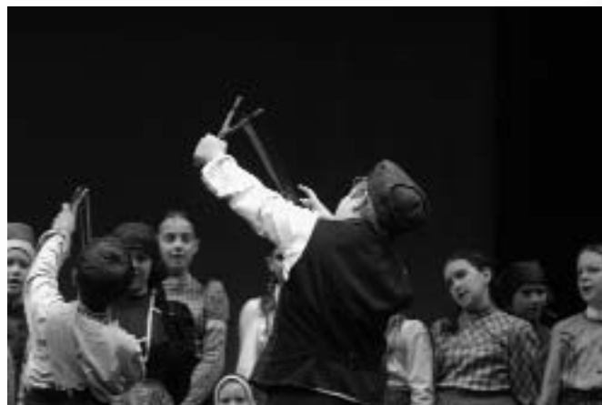
Streljanje s fračo – ena od priljubljenih fantovskih iger. Otroška folklorna skupina Lončki iz Dolenje vasi pri Ribnici v odrski postavitvi Leti, leti črni kos. (, regijsko srečanje otroških folklornih skupin, Postojna, 12. 5. 2009.)

Ena skupina otrok je predstavljala ribe, druga ribiče, ki so lovili ribe, in tretja – bila sta dva ali največ trije – žandarje, ki so lovili ribiče. Vloge so razdelili po dogovoru ali jih je določil vodja igre, lahko pa so se razdelili tudi z izštevanjem. Ribiči so imeli vilice na tri roglje, pritrjene na palico ali vsaj kaj, kar je spominjalo nanje – kakor so videli pri odraslih, ki so lovili s čolna. Tekali so za "ribami", jih "nabadali" – "štokali" in vpili: "Ribežaus, ribežaus!" Žandarji pa so lovili ribiče.