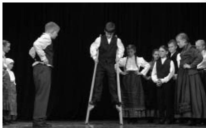
Hoja s hoduljami. Otroška folklorna skupina Podružnične osnovne šole iz Zgornje Ložnice v odrski postavitvi Bejžmo, teta Pepca gre.

Tudi ta igra je iz Babnega Polja, predvsem igra starejših fantov. Igra se v parih kot prejšnja. Prvi igralec iztegne roke z