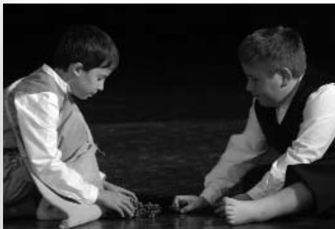
Igra s storži v izvedbi Otroške folklorne skupine Podružnične osnovne šole Javorje Osnovne šole Črna na Koroškem.

Igralci stojijo v krogu, ki ima polmer kak meter in pol ali več, vsak ima pred sabo izkopano jamico in v rokah palico. Tudi v sredini je jamica, v njej pločevinasta škatla ali kak drug primeren predmet – "prasica". En igralec je "odveč" in on začne riniti "prasico" drugim v jamico, oni pa njemu nazaj. Igralec, ki ne ubrani svoje jamice in dobi "prasico"