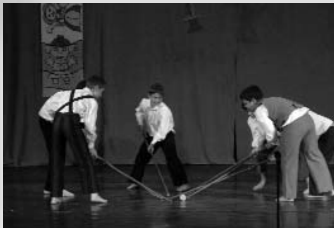
Otroci prikazujejo igro prasico biti. Otroška folklorna skupina iz Rogoške Slatine v odrski postavitvi Veseli čas prihaja.