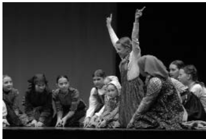
Leti, leti ... Otroška folklorna skupina Lončki iz Dolenje vasi pri Ribnici v odski postavitvi Leti, leti črni kos.

Pari lahko tekmujejo med seboj, izpade vsak, ki naredi napako, zadnji zmagaja. (Jože Komidar, 1954, Žerovnica – Hudi Vrh, 2003)