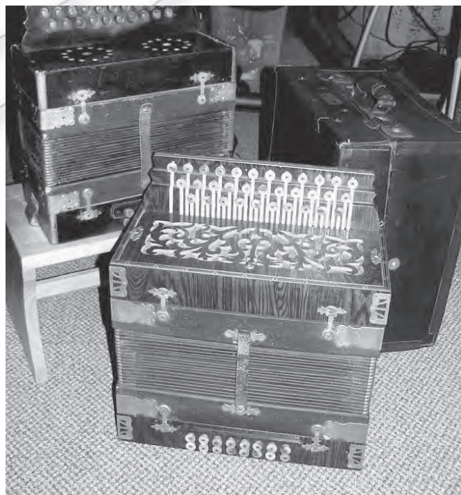
Harmonika z začetka 20. stoletja, ki jo hrani Tomaž Rauch.