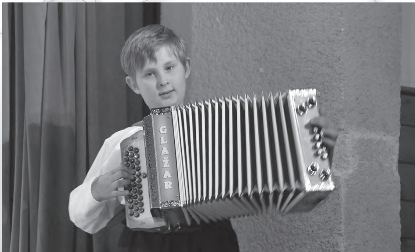
Godec otroške folklorne skupine iz Šmartnega pri Litiji z novo harmoniko sinje modre barve (barve žal v črno-beli tehniki tiska ne morete videti), opremljeno z vidnim napisom izdelovalca.

Ko so harmonike ob koncu devetnajstega stoletja še bolj pa v začetku dvajsetega prevzele pomembno vlogo v naši ljudski glasbi, so bile v uporabi največkrat preproste (v začetku na tujem kupljene ali s tujega prinesene) dvovrstne ali celo enovrstne harmonike. Imele so preproste registre – po eno piščal za vsak zvok, še večkrat po dve (tremolo), to pa je bilo tudi vse. Ko so se pojavili domači izdelovalci (nemalokrat tudi le sestavljalci oziroma oblikovalci), so že postajali »moderni« močnejši, kmalu tudi t. i. helikonski basi, ki pa so zahtevali tudi močnejše melodične glasove. Torej več glasilk in večji meh. Hitro se je pojavila tudi tretja vrsta »melodičnih gumbov« (kot kaže ohranjeno gradivo že pred prvo svetovno vojno), tu pa se je