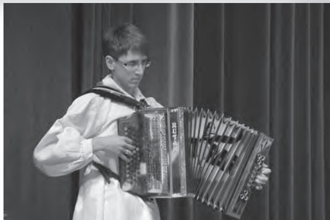
Izdelovalci diatoničnih harmonik se prilagajajo tržišču in izdelujejo harmonike, ki so precej glasnejše od nekdanjih in se tudi po videzu približujejo željam današnjih naročnikov. Na fotografiji je godec Folklorne skupine Kulturnega društva Svoboda Mengeš.

stvar za več desetletij kar nekako ustavila. In najbrž bi še danes stala, če ne bi igranje na diatonično harmoniko poleg glasbe postalo tudi šport in so zaradi tekmovalnega duha sodobnega človeka pričeli organizirati razna tekmovanja in prvenstva. Seveda predvsem zaradi občinstva in zasluzka, potem šele zaradi razvoja tehnike igranja, ki pa je svoje tudi dobila. Skratka, tako zvok kot način igranja je po drugi svetovni vojni najprej počasi, s priljubljenostjo narodno-zabavne glasbe pa vedno hitreje pridobival nove in nove gumbе in druge prvine, po sedemdesetih letih 20. stoletja pa se je pojavljalo še več in več novih primesi