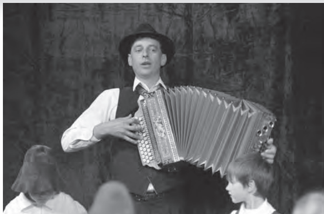
Godec na trivrstno diatonično harmoniko. Otroška folklorna skupina VVZ Slovenj Gradec, Enota Dolič.