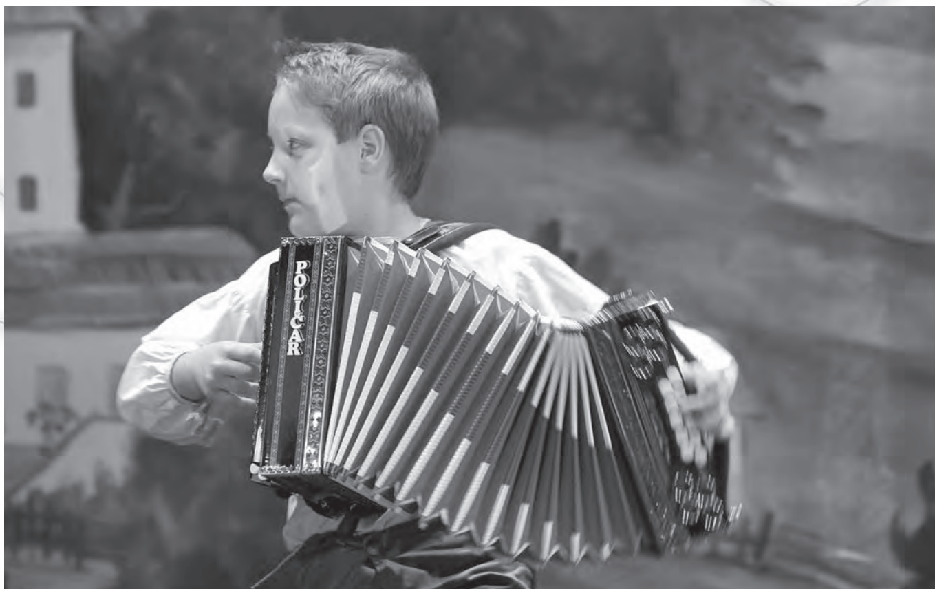
Harmonike sodobnejšega videza so priljubljene zlasti med mladimi. Godec Otroške folklorne skupine iz Šentjerneja.

Glede videza harmonike se danes skoraj nihče v folklornih skupinah ne sprašuje, ali je ustrezen. Morda pa bi bilo vendarle pametno premisliti, ali ne bi bilo bolje namesto novega