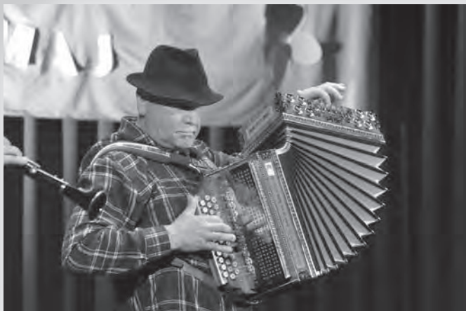
Stara viža na staro harmoniko zazveni povsem drugače kot na novo. To bi bilo vredno vsaj kdaj poskusiti, še bolj koristno pa bi bilo to upoštevati v praksi. Godec iz Gračišča na regijskem srečanju pevcev ljudskih pesmi in godcev ljudskih viž.

uporabiti kako staro glasbilo. Domačih harmonik je še vedno veliko, če pa že te niso dosegljive, je danes svet tako majhen, da prek spleta in podobnih poti (boljši trgi, sejmi ipd.) lahko z relativno majhnimi finančnimi vložki pridemo do pravih biservov, ki bi jih bilo na odrih vredno pokazati. Res je, da so ti nakupi povezani s tveganjem. Ampak cene starih glasbil so v primerjavi z novimi »čudesi« bistveno nižje. Iz izkušnje vem, da solidno ohranjena stara harmonika skupaj s servisom ne stane več kot četrtno, petino, včasih celo le desetino cene novega glasbila. Tudi v primerjavi s stroški izdelave oblačil in nabave ustreznega materiala za njihovo izdelavo to ni tako veliko. In če ima godec nekaj volje, da se pozabava z nekoliko drugačnim načinom igranja, je folklorni dejavnosti ustrezen rezultat zagotovljen. Tudi način igranja na takšna glasbila je preprostejši od sodobnega, je pa seveda res, da ta bolj ustreza tistim, ki dobro slišijo, in manj tistim, ki so vajeni učenja po notah ali na pamet.