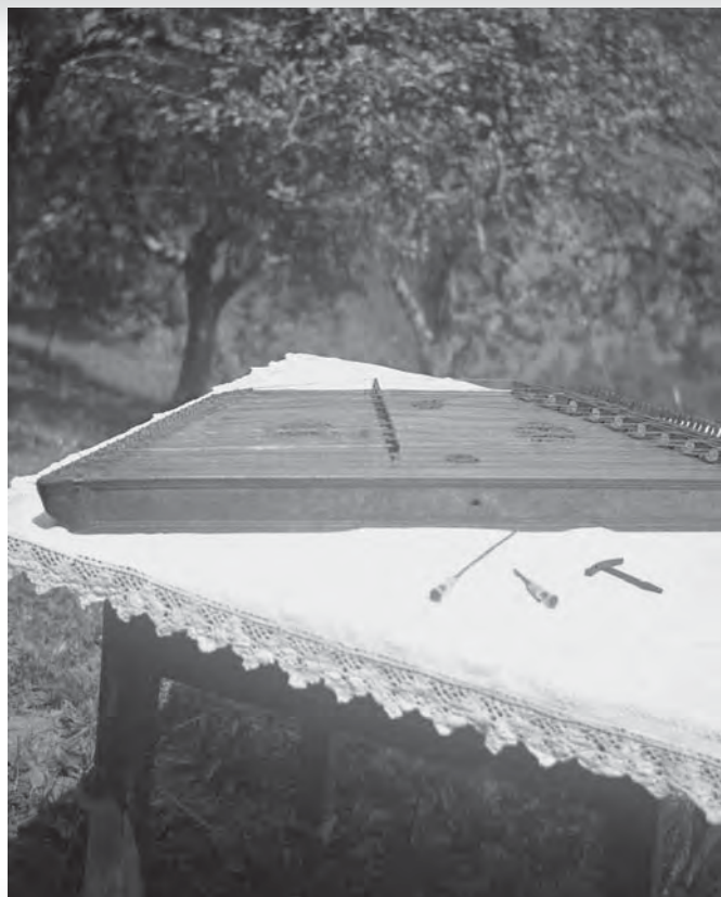
Oprekelj (»aprikel«), ki ga danes hrani Slovenski etnografski muzej. Oprekelj je bil najden na terenskem raziskovanju Slovenskega etnografskega muzeja na Cerkljanskem.

Največ strokovnjakov meni, da oprekelj izhaja z območja arabsko-perzijske kulture. Glasbilo, imenovano santir in arabsko ganun , naj bi se v Evropo razširilo z arabskimi vdori, ki so potekali iz severne Afrike čez Španijo. Redkejši so mnenja, da so ga prek Turčije in Balkana v Evropo prinesli madžarski cigani.