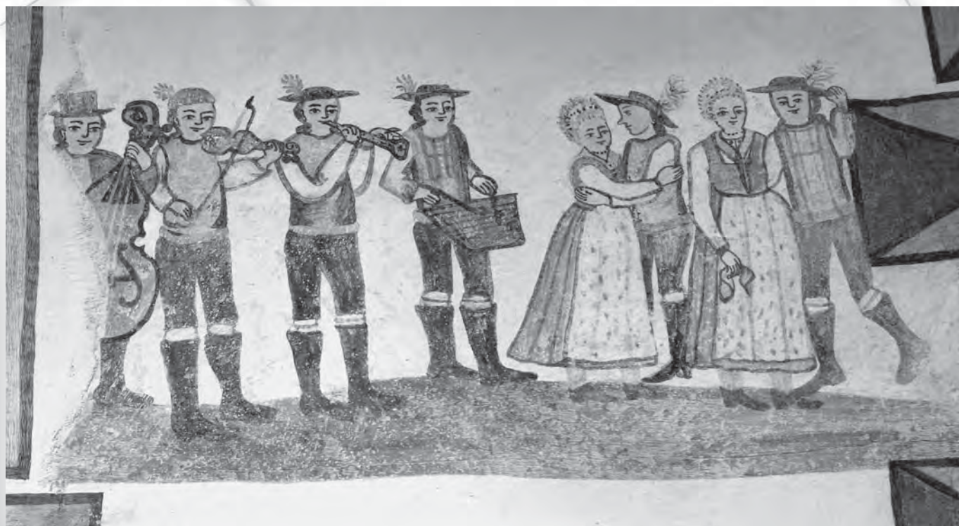
Freska, na kateri so štirje godci, ki igrajo na bas, violino, klarinet in oprekelj. Fresko so odkrili na domačiji Eržen v Zabrdi v občini Železniki leta 2004, jo obnovili in blagoslovili 4. 9. 2010.