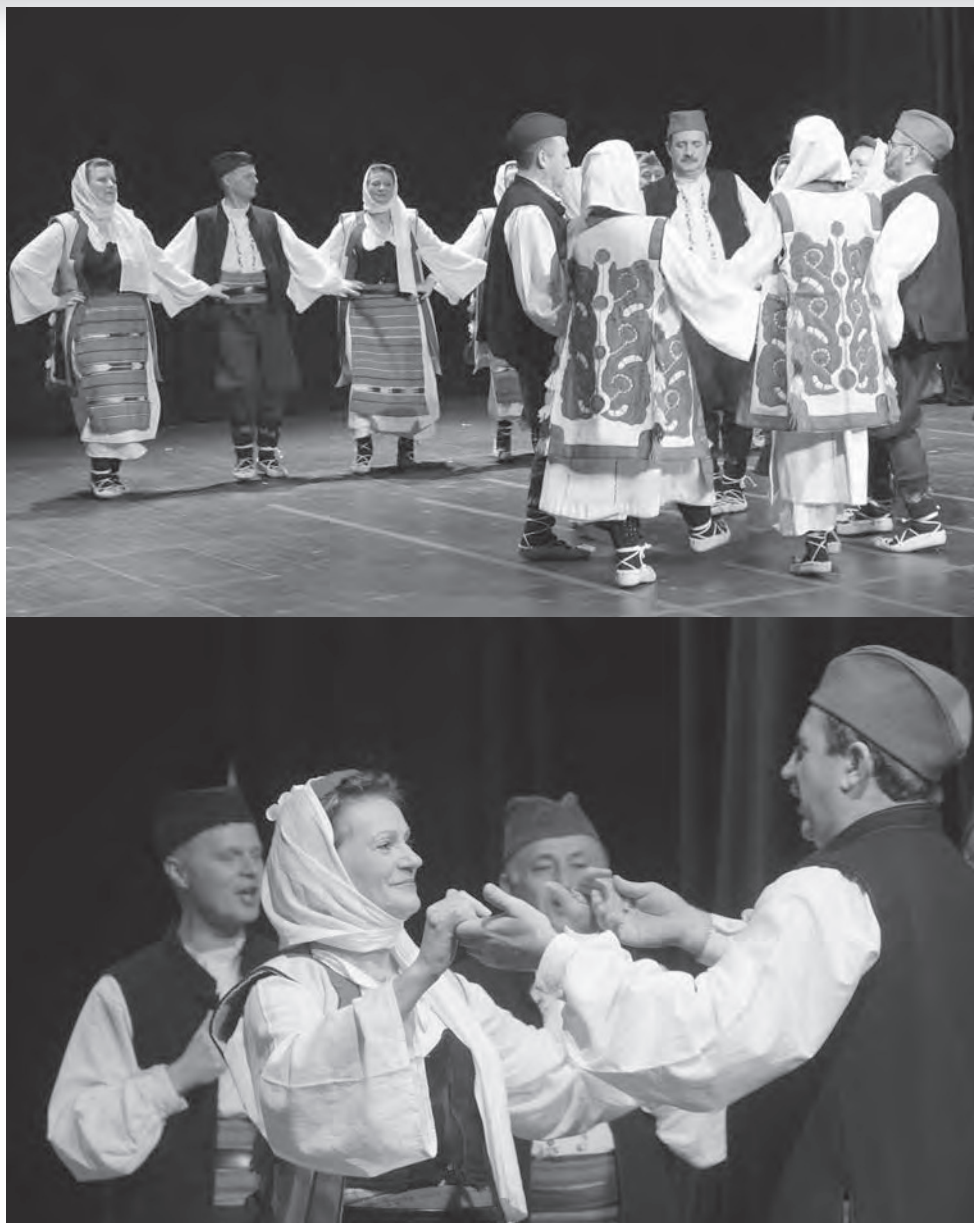
Veteranska folklorna skupina Akademskega kulturno-umetniškega društva Kolo iz Kopra. (, regijsko srečanje folklornih skupin manjšinskih etničnih skupnosti, Koper, 27. 3. 2010.)