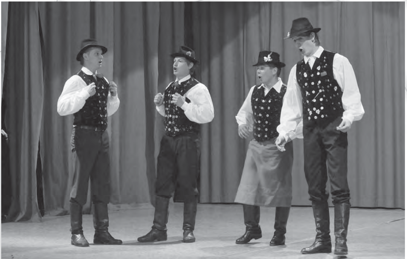
Folklorne skupine na Slovenskem se poustvarjanju pevskega izročila posvečajo bolj ali manj intenzivno, brez dvoma pa vključevanje pesmi prispeva k pestrosti programa folklornih skupin. Na fotografiji je folklorna skupina iz Cirkovc.

Vokalna delavnica z Ljobo Jenče je del obsežnejšega programa poklicnega izobraževanja z naslovom Gibalno in glasovno izročilo preteklih stoletij , ki ga pripravlja KUD Corte-