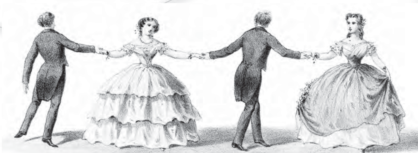
Grlica – 3. figura četvorke iz prikaza poučevanja plesa.