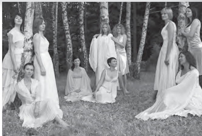
Pevska skupina Katice pri fotografiranju za zgoščenko. (Foto: Matjaž Banič, oktober 2009.)

Katice se pesmi lotevajo na različne načine; večina zazveni v večglasju, sem ter tja pa kakšno zapojeta le dva oziroma štirje ženski glasovi. Pesmi preveva slovesnost in vzvišenost, večkrat pa tudi sakralnost, saj je veliko pesmi o Jezusu, Mariji in Jožefu. Kljub temu nekateri napevi delujejo šaljivo, nagajivo, prifrknjeno. V to kategorijo sodi štepec pesmi, ki so jih Katice zapele