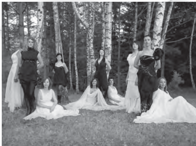
Pevska skupina Katice pri fotografiranju za zgoščenko. (Foto: Matjaž Banič, oktober 2009.)

Na albumu Oj, fijole, novo leto je! je Katicam uspelo lepo ujeti govorne in harmonske posebnosti ter odtenke različnih slovenskih pokrajin, kakor tudi različnosti zadane si tematike. Pristrčne in ubrano odpete pesmi se večje sprehajajo med ljudskim izročilom in modernim poseganjem po dediščini ter njeno posodobljenostjo. Ob vsem potrošniškem, bučnem in nasilnem norenju okrog »veselega decembra« predstavljajo prepotrebno iskrico skromnosti in preprostosti, ki vas prevzame in premakne v lepšo paralelno realnost, ne glede na to, ali, denimo, besedo »Jezus« uporabljate le kot nezavedno mašilo ali pa jo izgovarjate s spoštovanjem v molitvi. Katicam se zahvaljujemo za lepo voščilo, ki so nam ga ponudile ob koncu leta 2009, in voščilo tudi vračamo – z željo, da na njihovo naslednje prikupno darilo ne bo treba čakati osem let!