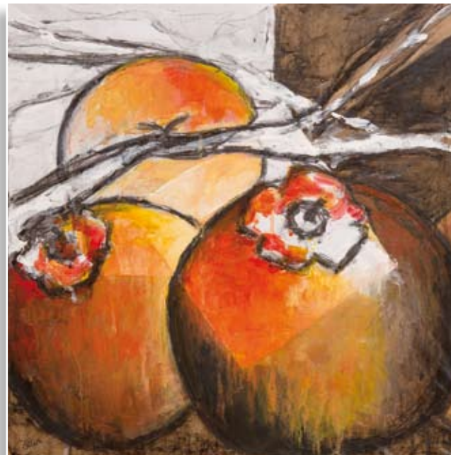
Zdenka Petek Zlato jabolko • 50x50 • mešana tehnika