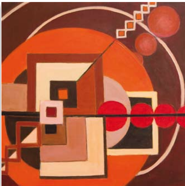
Iva Rebec Moje barve • 50x50 • akril