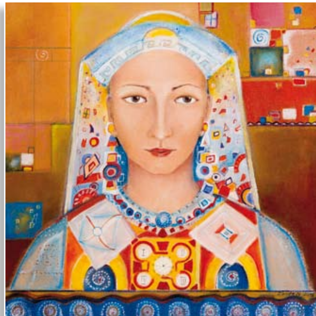
Nataša Zirnstein Varuh časa • 40x40 • mešana tehnika