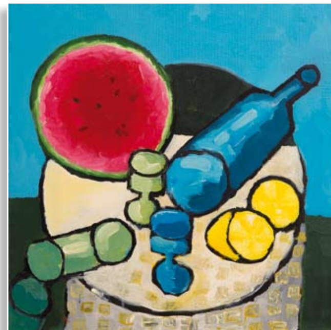
Saša Kuder Tihožitje • 50x50 • akril na platnu