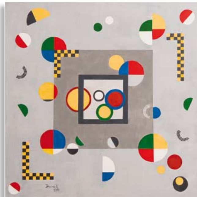
Irena Kariž Otroška igralnica • 58x58 • akril na platnu