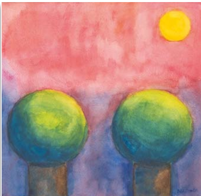
Blaženka Rocco Drevored • 40x40 • akvarel