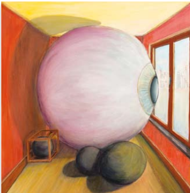
Jelka Suklan Pogled • 50x60 (50x50) • akril