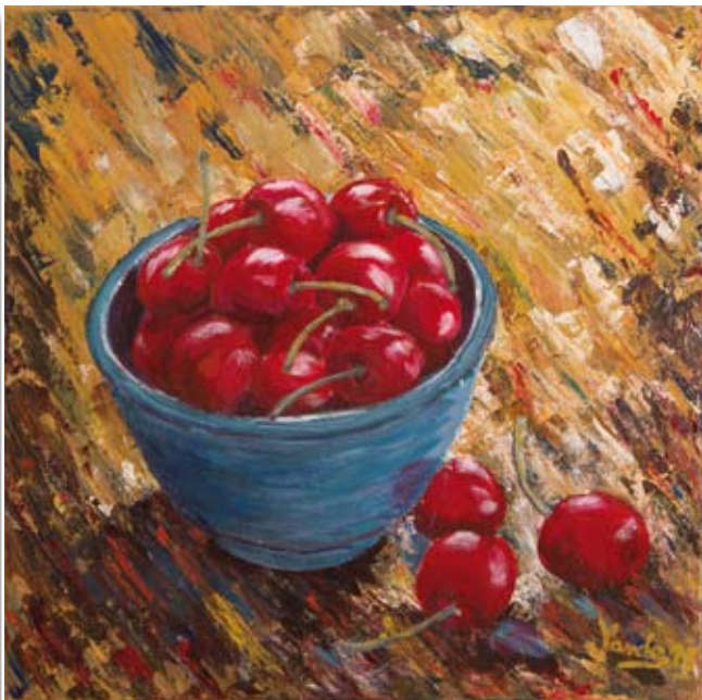
Vanda Nedič Črješnje • 40x40 • akril