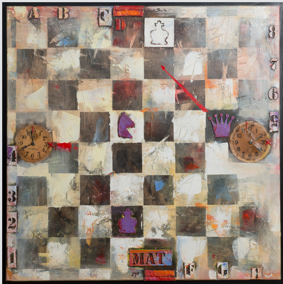
Danilo Jereb , Idrija | Mat | 70x70, mešana tehnika, akril