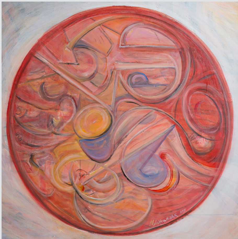
Milovan Novak, Ozeljan | Kaos | 100x100, akril