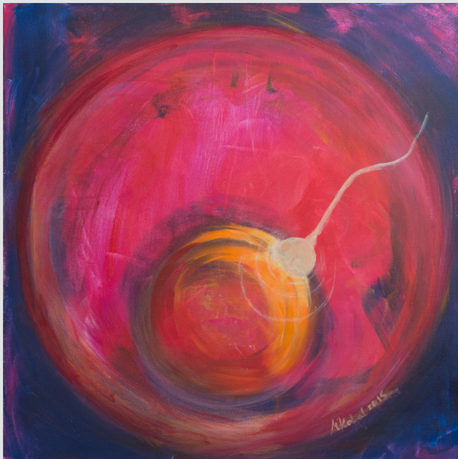
Marica Kobal , Renče | Spočetje | 60x60, akril, suhi pastel