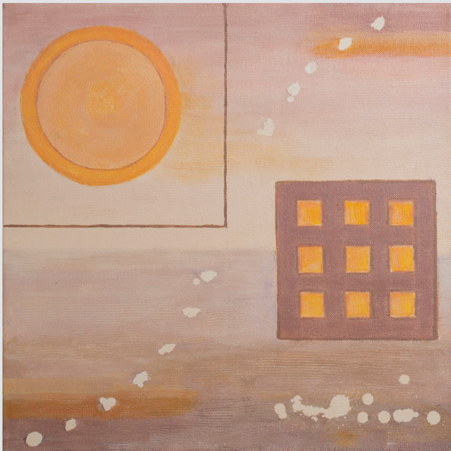
Zorana Kosovel, Solkan | Energija | 40x40, akril