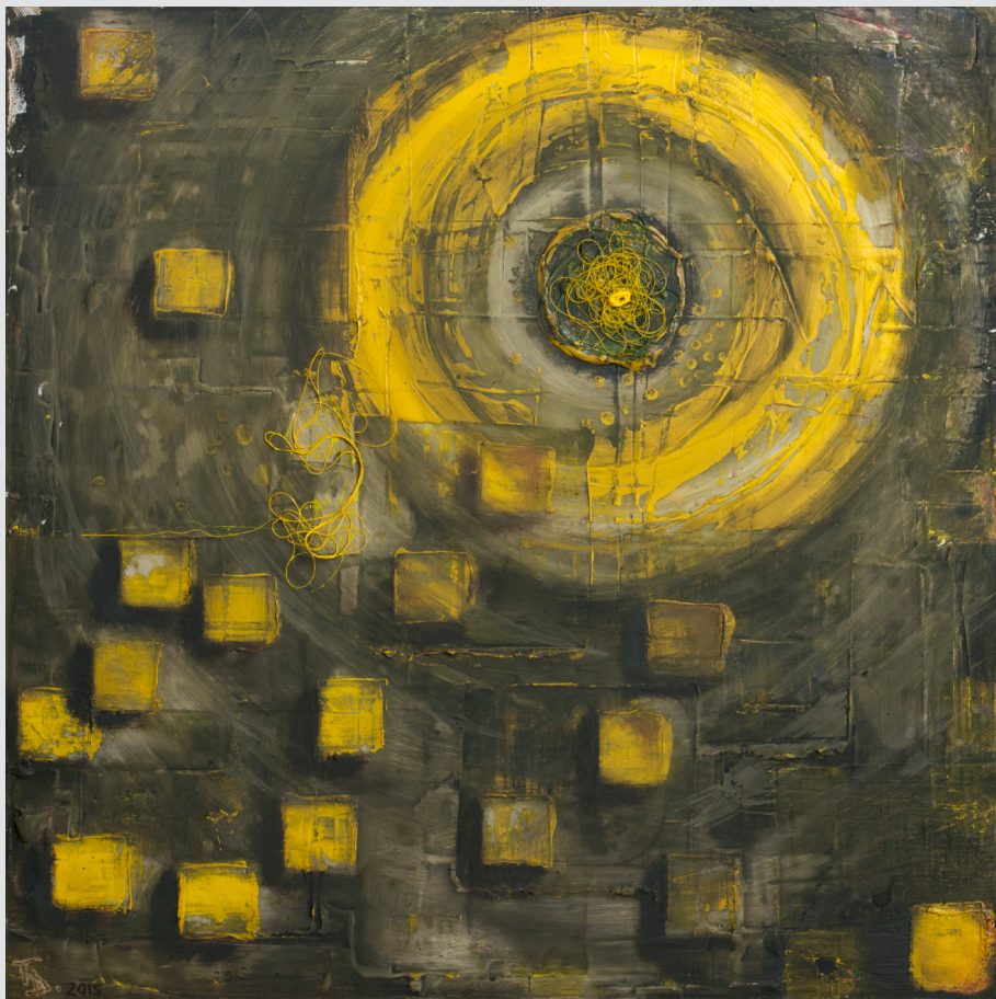
Dare Trobec , Most na Soči | Nekoč... nekje ... | 60x60, akril