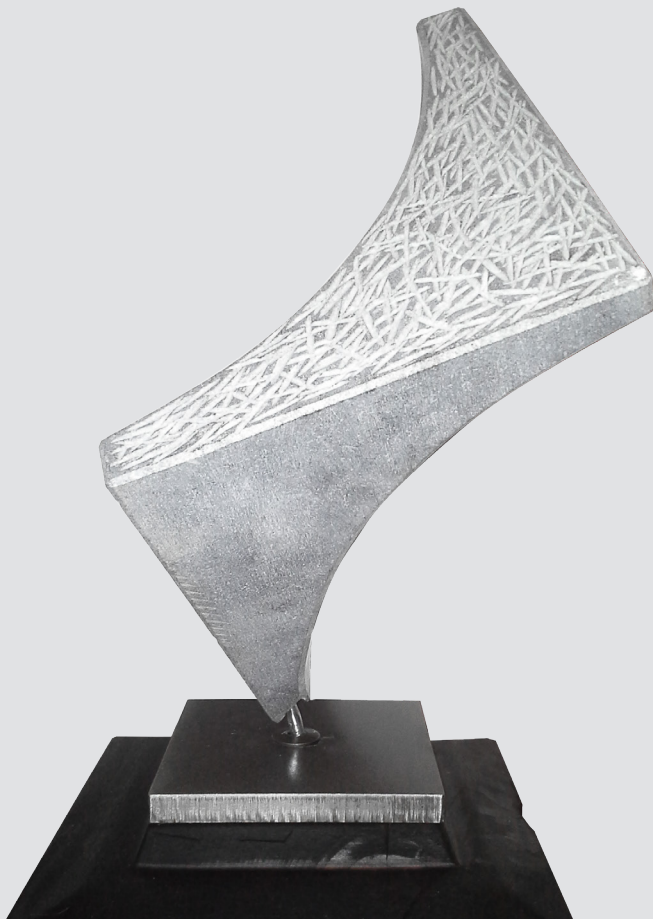
Arijel Štrukelj , Ajdovščina | Collision | 25x25x25, kamen, les, železo