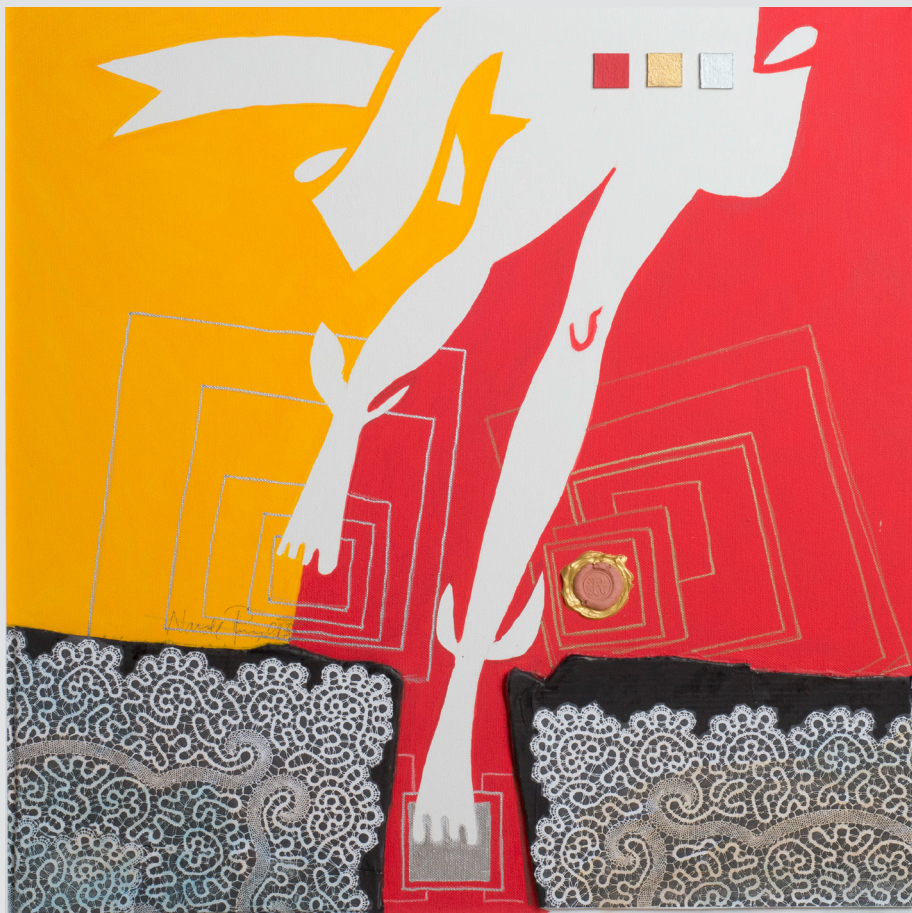
Nande Rupnik, Idrija | Odhajajoči Merkur | 58x58, akril, mešana tehnika