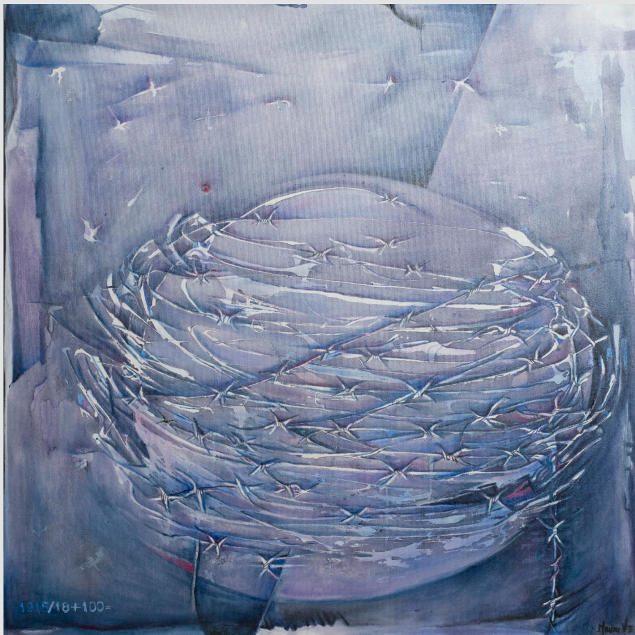
Vera Elvira Mauri, Gorica | 1915/18+100= | 80x80, olje