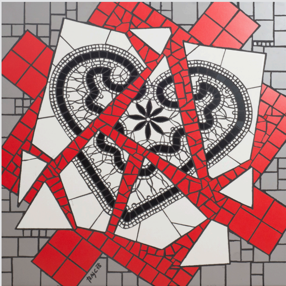
Silvester Bajc , Idrija | Rdeči kvadrat | 60x60, mozaik