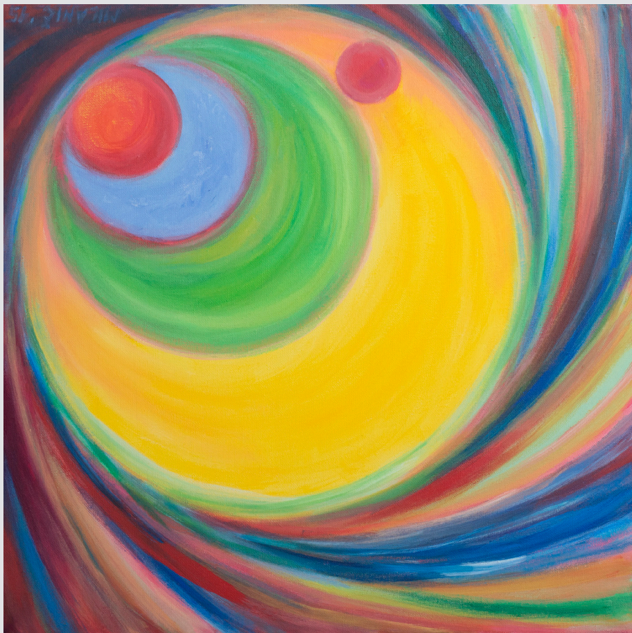
Marijan Milanič , Dobrovo | Kroženje | 50x50, akril