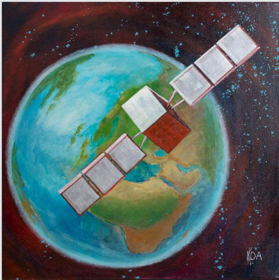
Ida Kocjančič, Miren | Pogled iz orbite | 58x58, hidro olje, akril