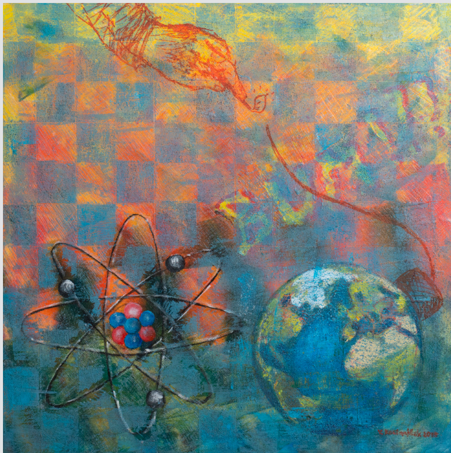
Vera Kostanjšek, Idrija | Začarni krog | 70x70, akril, vosek, mivka