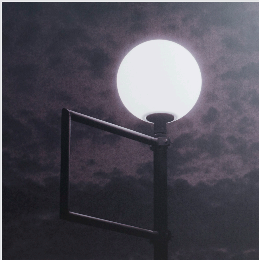
Darja Gruntar , Kobarid | Svetilka | 49x49, fotografija