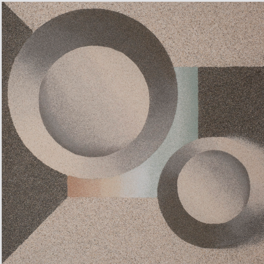
Stanka Golob , Grahovo ob Bači | Migracije | 93x93, slika iz peska