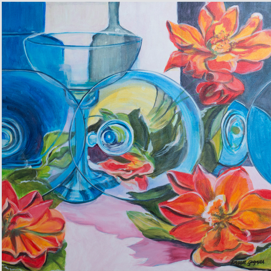
Ljiljana Lisjak, Nova Gorica | Primorski vrt | 60x60, akril