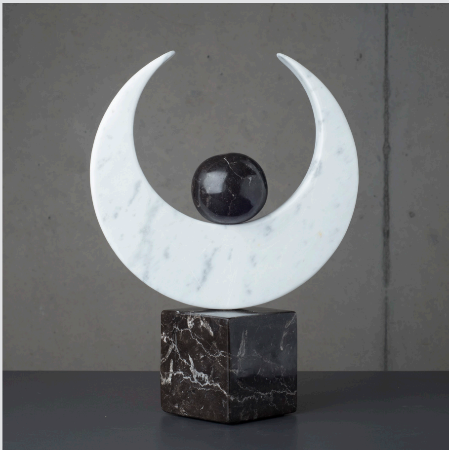
Elda Breclj, Črniče | Svet v objemu lune | 30x11x40, kamen