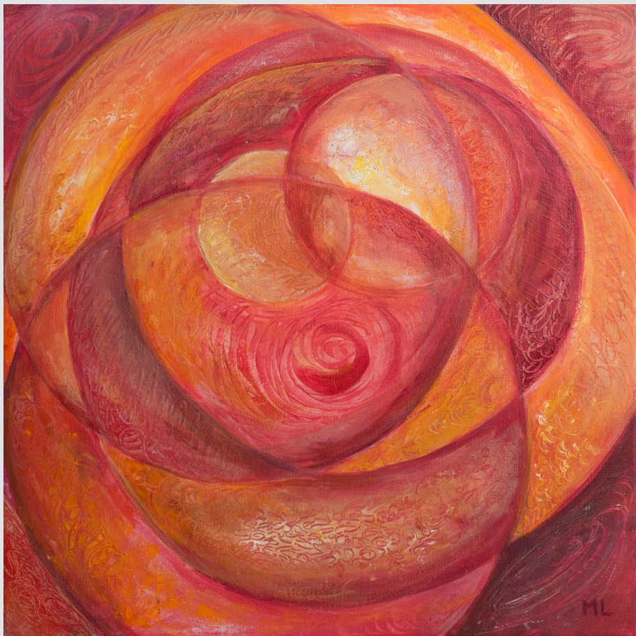
Miranda Leban, Prvačina | Prepletanje | 50x50, akril