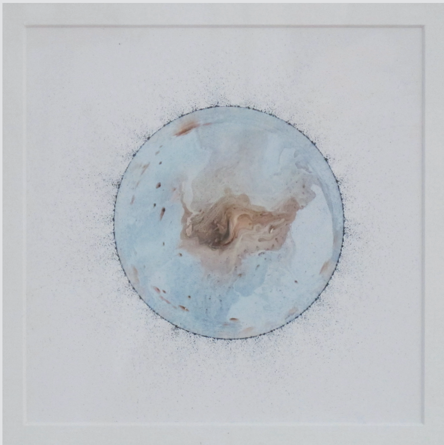
Ina Stergar , Kobarid | "lana" - iz cikla Astrali, serija Oniks | 20x20, aqua ink, barvni tuš