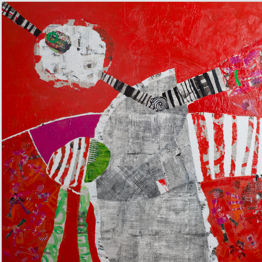
Nevenka Šutila, Solkan | Veselite v parku | 100x100, kolaž