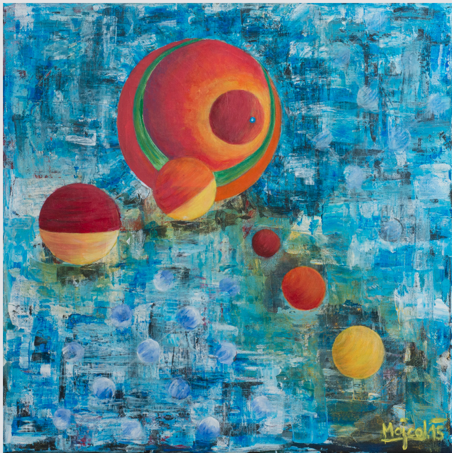
Mojca Ivančič , Kobarid | Oko veselja | 40x40, akril, pastel