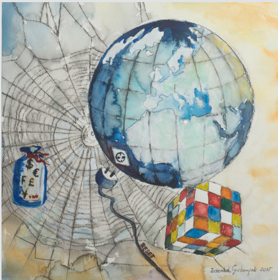
Zdenka Grebenjak, Nova Gorica | Svet - ujet v pajkovo mrežo (elita) 48,5x48,5, akvarel, gvaš